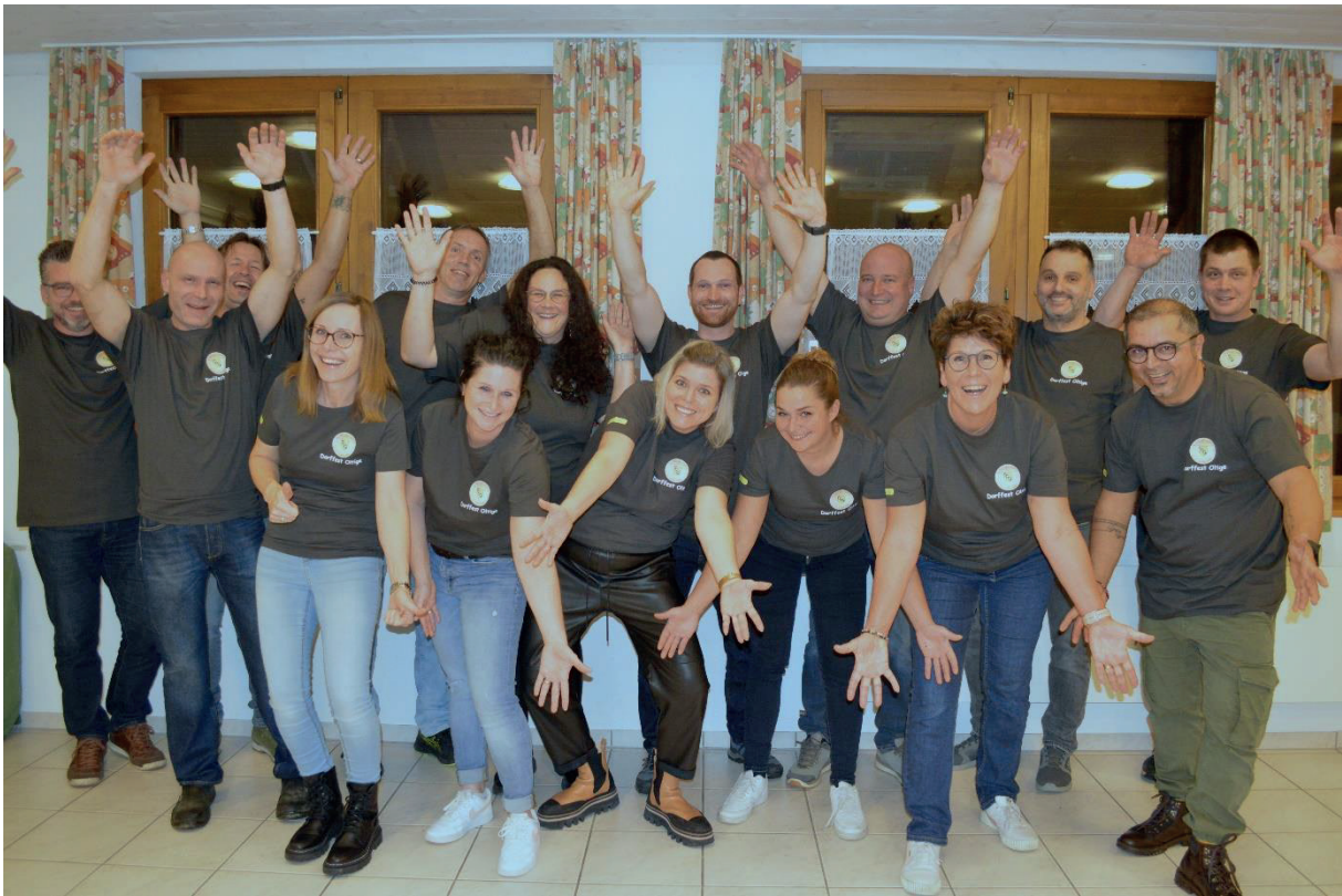
z'Oltige rollt's vom 1. -3. Mai 2026, es Dorffest wie vor 50 Jahr