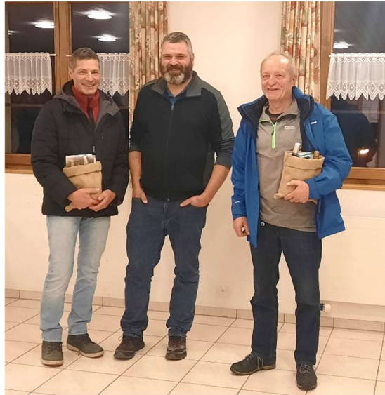
Verabschiedung an der Gemeindeversammlung vom 14. Dezember 2022

Für ihren Einsatz von 1992 bis 2022 danken wir herzlich und wünschen ihnen für die Zukunft alles Gute.