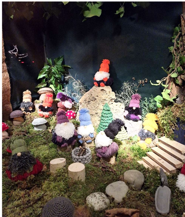
Adventsfenster: Doris Rickenbacher

Ein glückliches, gesundes und erfolgreiches Jahr 2024 wünscht der Gemeinderat und die Gemeindeverwaltung