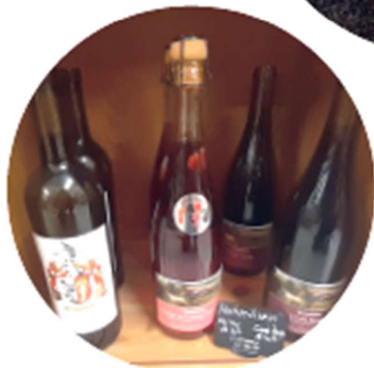
Weine von Vogt, Rünenberg und Grosstannen, Bad Bubendorf