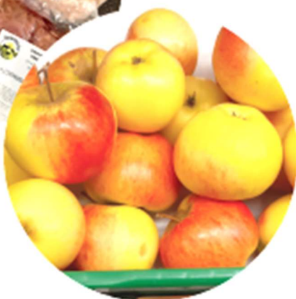
Obst und Gemüse von lokalen Bauern