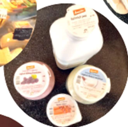
Demeter-Milchprodukte vom Gitziberg, Rohr