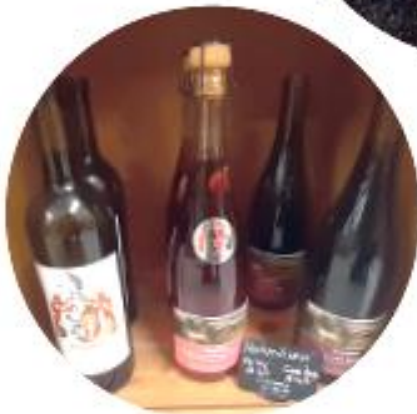
Weine von Vogt, Rünenberg und Grosstannen, Bad Bubendorf