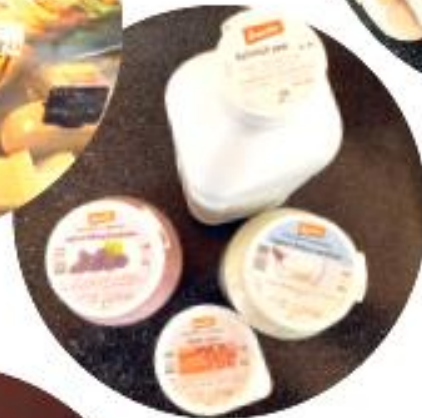
Demeter-Michprodukte vom Gitziberg, Rohr