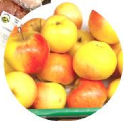
Obst und Gemüse von lokalen Bauern