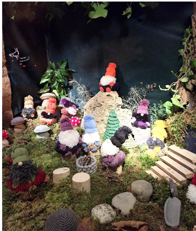
Adventsfenster: Doris Rickenbacher

Ein glückliches, gesundes und erfolgreiches Jahr 2024 wünscht der Gemeinderat und die Gemeindeverwaltung