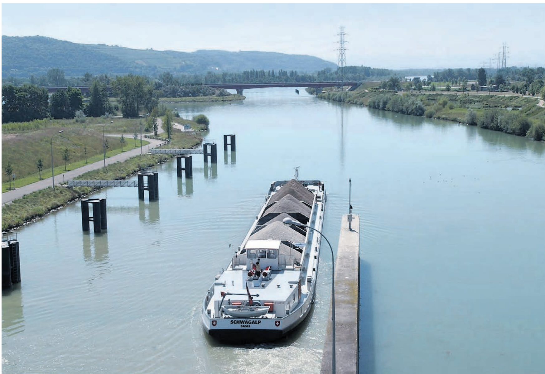
Schlüsselstelle. Das 13 Kilometer lange Teilstück zwischen Niffer und Mulhouse ist bereits ausgebaut worden: Der Kilometer kostete sechs Millionen Euro.

Rolf A. Vogt bilanziert die Vorteile, die die neuen Kanäle bringen würden: eine Verdoppelung der Transportkapazitäten auf den Wasserstrassen zwischen den Seehäfen und der Schweiz; eine Verkürzung des Seeweges von und nach Asien; eine Schiffsanbindung an die Mittelmeerländer; schnellere Anbindung der Export- und Importmärkte