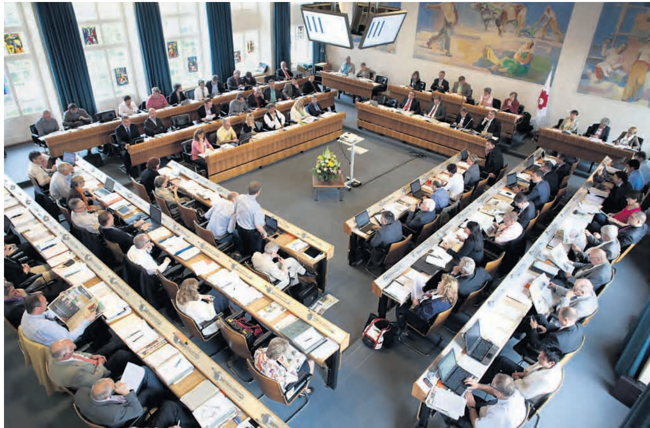
Neuverteilung. Die Kommissionssitze des Landrats sollen neu auch wieder entzogen werden können.

GPK-Bericht mit neuen Vorschlägen und deutlicher Kritik an Regierung