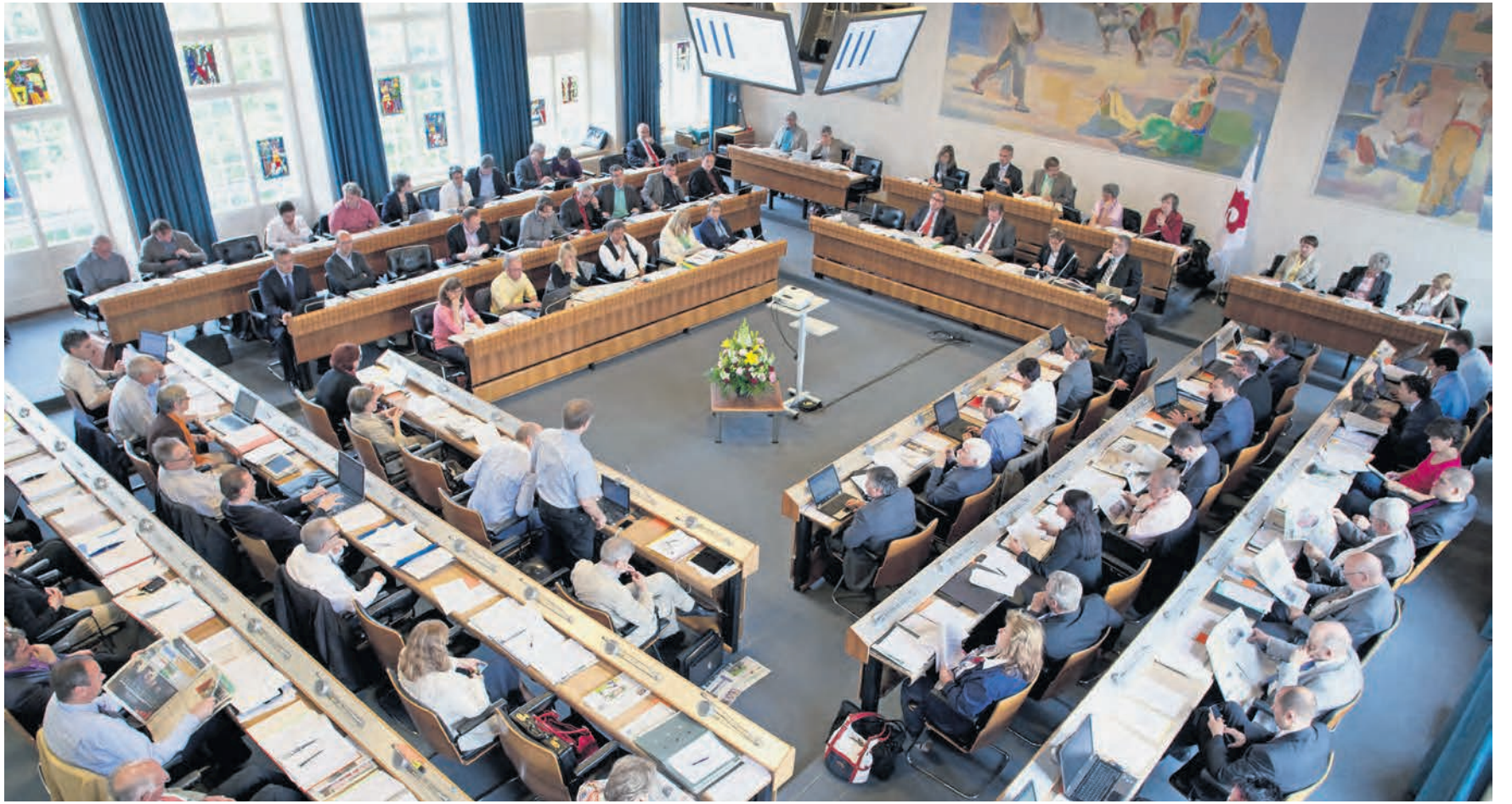
Forderung. Die Verteilung der Kommissionssitze der Baselbieter Parlamentarier soll geändert werden.

Fraktionen sind sich mehrheitlich einig: Fraktionslose sollen Kommissionssitz abgeben