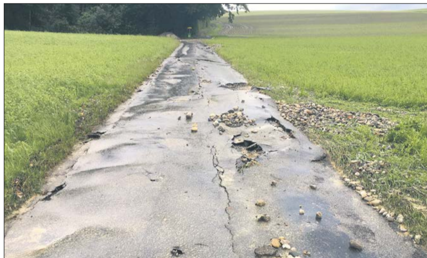
Fliesst in kurzer Zeit viel Wasser ab, nehmen Felder und Strassen Schaden (hier im Kanton Bern). Für die Prävention braucht es Zusammenarbeit.

«Agronomische Massnahmen sind schneller umsetzbar als hydrologische», fasste er zusammen. Zur Dimensionierung von kleineren Retentionsbecken dienen ökohydrologische Modelle, aber auch den Wasserbedarf auf dem Betrieb gilt es zu beachten. Je nach Situation können die Becken mit oder ohne Versickerung gebaut werden, um entweder die Bodenfeuchtigkeit zu verbessern oder als Reservoir für die Bewässerung zu funktionieren. Geschickt in der Landschaft platziert und auf die Bedürfnisse des Betriebs zugeschnitten, sind verschiedene Massnahmen sinnvoll. Jil Schuller