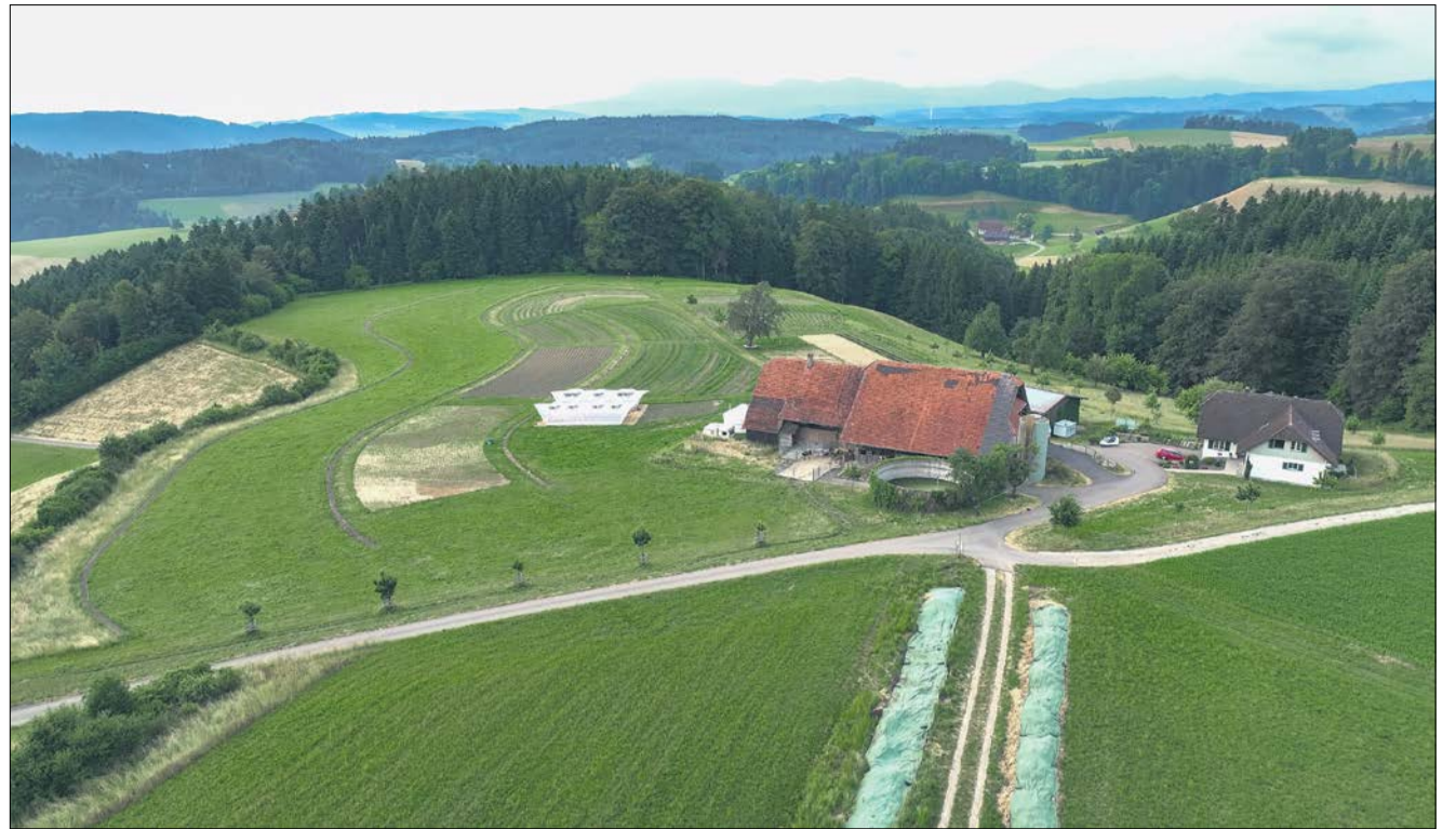
Auf dem Luftbild vom Juni 2023 sind die geschwungenen Gemüesfelder gut erkennbar. Auf dem Hof selbst ist ein Speicherbecken für Dach- und von der Ackerfläche abfließendes Regenwasser geplant.