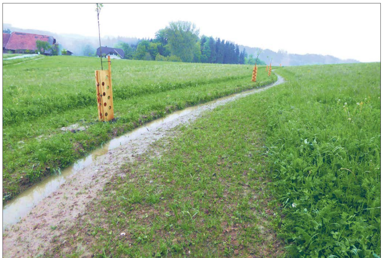
Den Verlauf der Wasserkanäle hat Markus Schwegler mit GPS-Daten abgesteckt und anschliessend eine Kante ausgebaggert. Darin soll das Wasser primär versickern oder bei zu grossen Mengen in den Speicher fließen.

Weitere Informationen: www.wasserkultur.ch