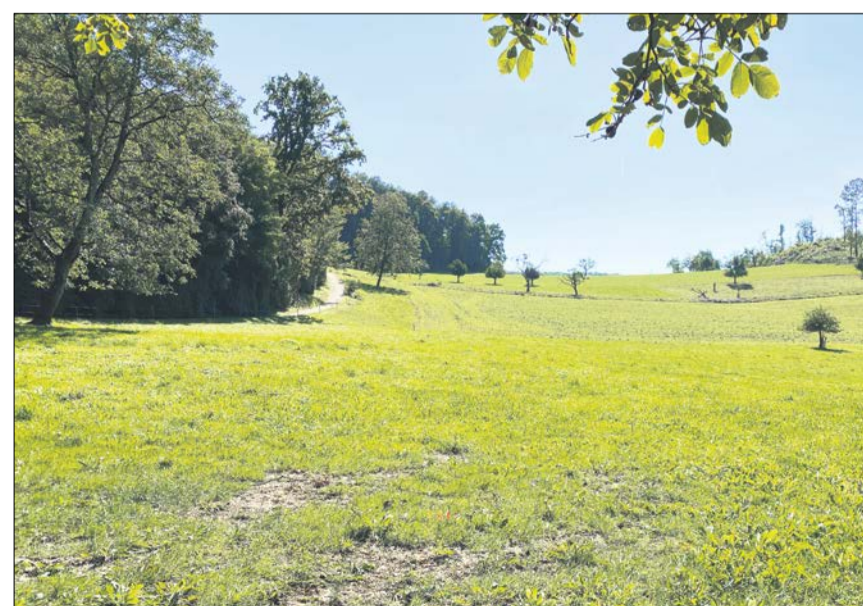
Das Gelände oberhalb des Waldes: Eine beweidbare Untersaat verhindert hier, dass nach der Getreideernte der Boden brach liegt.