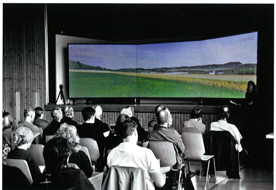
Abb. 3: Präsentation der 3D-Landschaftsvisualisierungen in der Gemeinde Blauen mit einem dreiteiligen Panorama-Leinwandssystem.

Auch das Direktzahlungssystem, welches künftig konsequent auf die von der Bevölkerung gewünschten gemeinwirtschaftlichen Leistungen der Landwirt-