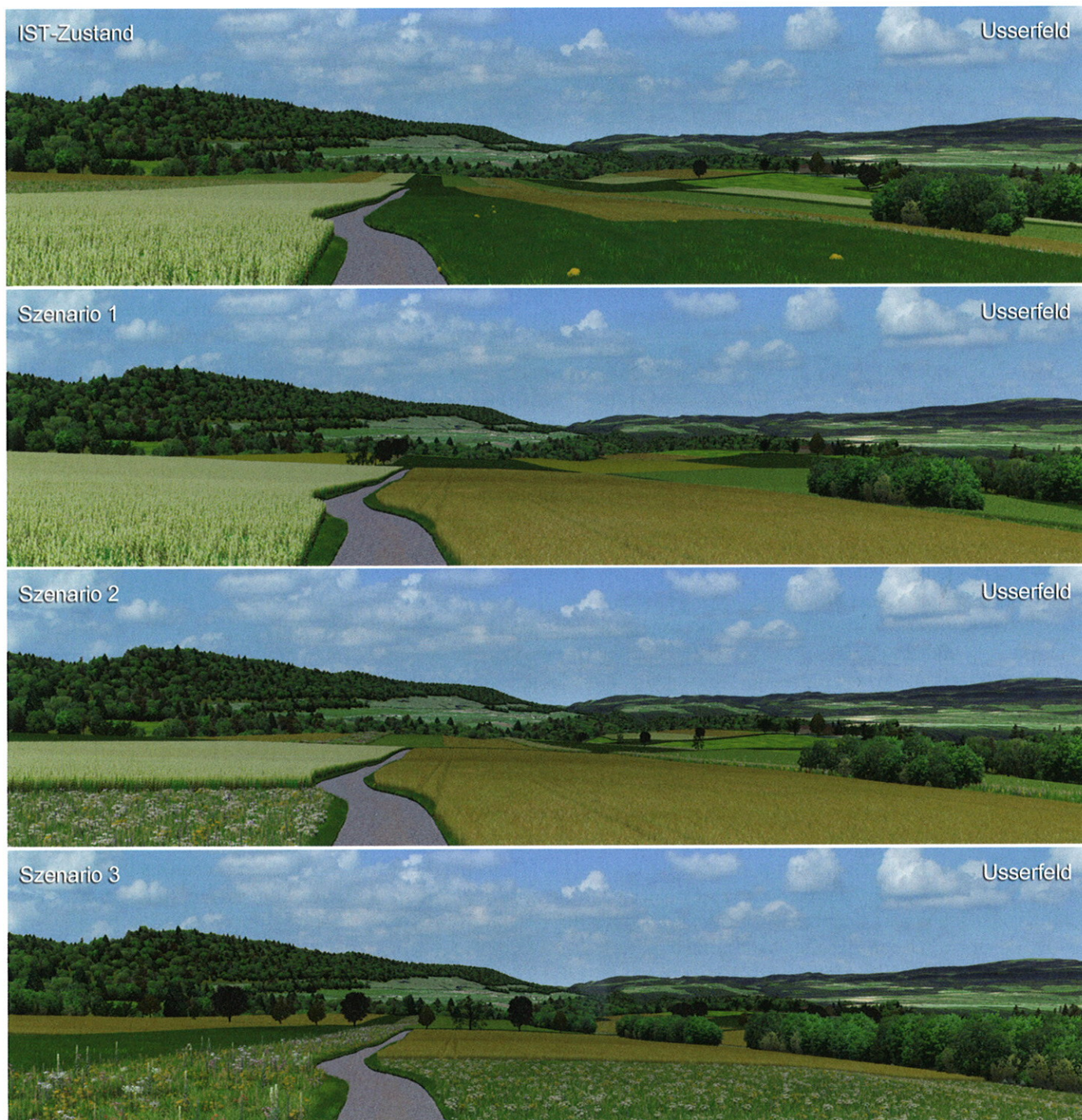
Abb. 2: GIS-basierte 3D-Visualisierung des Flurgebiets Ussefeld. In den Szenarien sind die arrondierten Parzellen zu erkennen sowie ökologische Flächen wie Buntbrachen oder extensive Wiesen. Beim Szenario 3 kommen weitere Strukturelemente wie Hecken und Baumreihen hinzu.

eignet sich für die Darstellung der Vegetation und von ökologisch wertvollen Strukturelementen, wie Hecken oder Hochstamm-Obstbäumen. Mit Hilfe von vor Ort aufgenommenen Fotos können sogenannte «Billboards» von lokalen