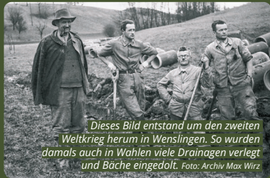
Dieses Bild entstand um den zweiten Weltkrieg herum in Wenslingen. So wurden damals auch in Wahlen viele Drainagen verlegt und Bäche eingedolt.

Drohnaufnahme der Diebachparzelle nach der Ausdolung (Januar 2024).