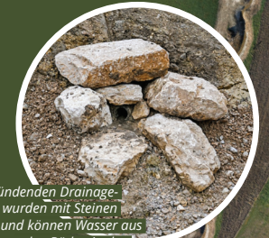
Die einmündenden Drainageleitungen wurden mit Steinen gesichert und können Wasser aus den umliegenden Böden in den Bach abgeben.