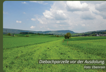
Diebachparzelle vor der Ausdolung.