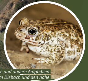
Die Kreuzkröte und andere Amphibien finden am Diebach und den nahe gelegenen, ebenfalls durch die Gesamtmelioration erstellten Ökoelementen mit Weihern einen neuen Lebensraum.