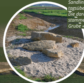
Sandlinsen bieten Kreuzkröten tagsüber eine Versteckmöglichkeit. Die darauf liegenden Sandsteinplatten stammen aus der nahe gelegenen Grube «Uf Sal».