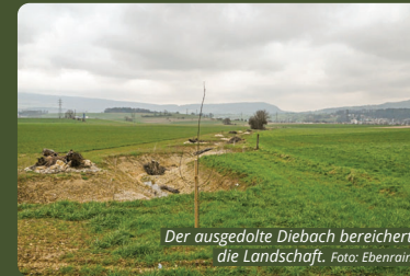
Der ausgedolte Diebach bereichert die Landschaft.