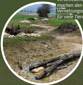
Verschiedene Kleinstrukturen machen den Bach als neue Vernetzungsachse attraktiv für viele Tiere.

Der ausgedolte Diebach ist eine wichtige ökologische Vernetzungsachse in der intensiven Ackerfläche wie auch eine Aufwertung der Landschaft. Im Bach schaffen Wurzelstockbuhnen, Störsteine, Steinschwellen, Raubbäume oder Weidenfaschinen eine vielfältige Struktur mit unterschiedlichen Fließgeschwindigkeiten. Am Ufer bieten Buschgruppen und Einzelbäume sowie Ast- und Steinhäufen oder Sandlinsen Reptilien, Kreuzkröten, Vögeln und Kleinsäugetern wie Wieseln Lebensraum und Unterschlupf. Die Uferstreifen werden von Landwirten gepflegt.