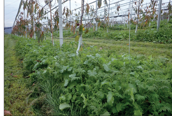
Abb. 3: „Wurzelpower“ einer rund zwei Monate alten, abfrierenden Gründüngung (hier Sanimix-Cherry) im Baumstreifen einer jungen Kirschenanlage.

4. Aufkalkung, wo nötig (anhand von Bodenanalyse, Kalk-Vorrat-Test am Bodenprofil oder an der Spatenprobe mit zehn prozentiger Salzsäure), denn ohne Kalzium können keine