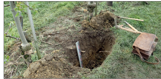
Abb. 1: Erstellung von (Mini-)Bodenprofilen von mind. 50 cm Tiefe

Wird Option A gewählt, ist die praktische Anwendung eine relativ einfache Angelegenheit: Nährstoffgehalte der Hofdünger anhand von Tabellen oder – besser – eigenen Analysen ausfindig machen. Danach gilt es, so viel der Produkte ausbringen, dass die Nährstoffbilanz ausgeglichen ist, um Unter- oder Überversorgung von Einzelnährstoffen vorzubeugen. (Anmerkung der Redaktion: In Deutschland sind zusätzlich Auflagen in Nitrat- und eutrophierten Gebieten (z. B. Nährstoffuntersuchung der verwendeten Wirtschaftsdünger und Höchstmengenbegrenzung nach BioabfallVO zu beachten). Die Kali- und Phosphor-Versorgung allein mit organi-